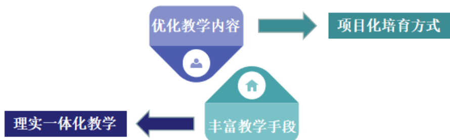
图 6 持续追踪优化教学内容、丰富教学手段

在示范专业建设引领下，学校各专业结合地方经济特色，通过政、企、校、师“四方协同”，积极开展教学资源建设，建设了教学资源库，组织教师自编讲义和活页式教材，开设本土化专业课程。学校在开设本土化专业课程的实践中，组织教师将自编讲义和活页式教材进行汇总，开展乡土教材的编写工作。例如旅游专业编写了《洪雅县农家乐(乡村酒店)服务》、《洪雅旅游文化》等教材。通过教学资源开发，如把“中国有机茶第一村”建设项目，引入旅游类专业、茶业类专业和电子类专业教学，从实际出发培养学生产业技能，使课程融入到项目开发中，改变了以往课堂教学的模式，根据项目开发中的实际情况设置课程内容，紧随项目的发展变化；把春驿