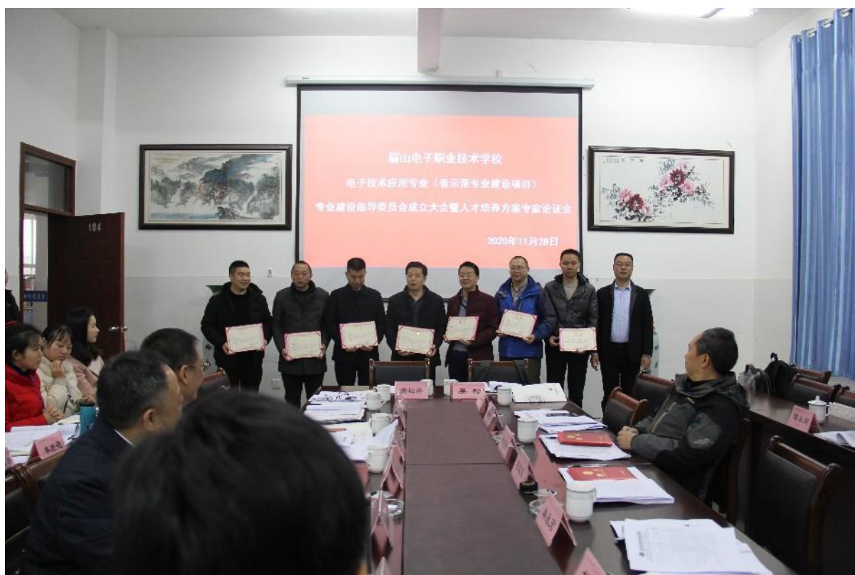
图3 专业建设指导委员会

在示范专业建设过程中，学校在专业建设委员会的指导下，以电子技术应用专业产教融合统领全校各专业建设，全面实行校企协同育人。学校建立专业随产业发展的动态调整机制，推动专业建设与产业转型升级相适应，围绕地方产业新办专业，新开办了直播电商服务等新专业。学校引入行业、企业专家和本地大师（工匠），共同组建专业建设指导委员会，在专业建设指导委员会的指导下开展专业建设工作。包括：建立专业建设动态调整的制度体系、组织开展专业调研、制定专业群建设规划、制定人才培养方案等。