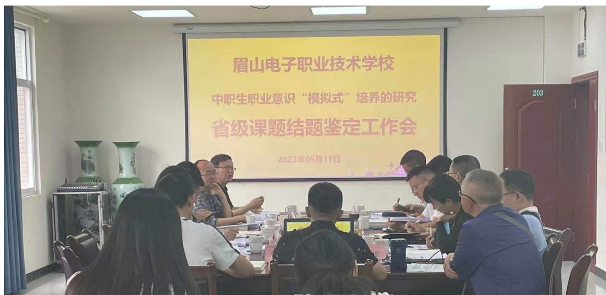
图 5 省级课题结题

3. 对标职业素养： 学校在人才培养过程中坚持“立德树人”，对标行业、企业对员工的职业素养要求，弘扬工匠精神，改变传统德育教育观念，开展学生职业意识培养，培养具有较好职业意识、职业习惯和清晰职业生涯目标的中职毕业学生，全面提高学生职业素养，增强学生职业适应能力，提高学生就业稳定率。