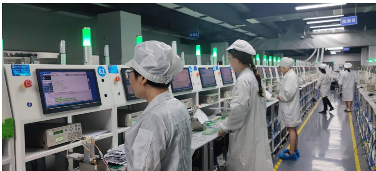
图 4 师生企业实践

同时，学校将“工匠文化、工匠精神”作为校园文化重要组成并精心打造。引进以巫炳松同志为代表的国家级林业专家人才，推动森林康养和